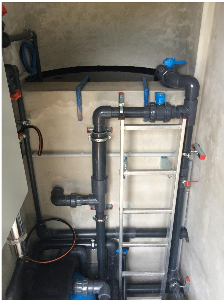
Povezava sistema z UV dezinfekcijo

Voda očiščena mehanskih delcev potem teče preko UV žarnic. Vgrajena je 1 UV amanganska žarnica. UV žarnica ima življenjsko dobo 365 dni . UV žarnice so učinkovite na intervalu od 50 do 75 W/m 2 . Pravilnost delovanja žarnic in intenzivnost svetilnosti se spremlja s signalizacijo na krmilni omarici. Celoten sistem je nadgrajen s SMS obveščanjem op pravilnem delovanju.