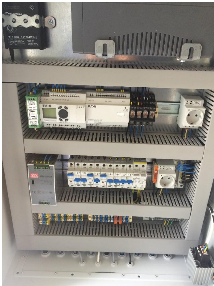
Vzpostavljen sistem SMS alarmiranja